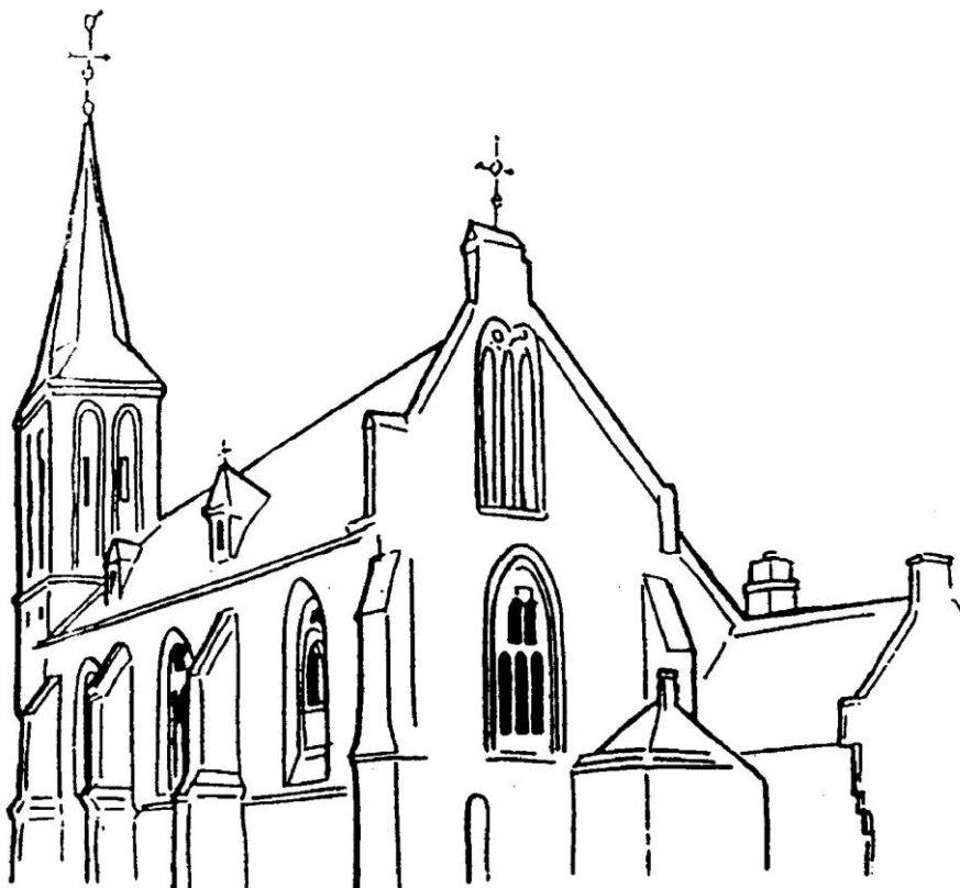
Gasthuiskerk te Doesburg